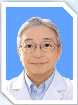
※本画像はchatGPTを使用して加工しています

月遅れになりますが、本年もどうぞよろしくお願いいたします。これまで人間社会は、様々な立場の人たちがお互いを認め合い、それぞれが自分らしい生活を目指す共生社会を目指してきました。国連が掲げるSDGs（持続可能な開発目標）や政府が策定している「地域共生社会の実現に向けた支援体制」などがその代表的な施策です。しかし昨今の社会状況を見渡すとその様な意識が薄らいで、人種、国籍、ジェンダーなどにおける少数派を排除しようとする流れが、一部とはいえ目立つようになっていきました。自分達の生活が良くなるのは、そういう人たちばかりが優遇されているからだ、というような偏った思い込みなどその理由は様々ですが、今後、障害福祉分野にもそのような論調が広がってこないか危惧しているところです。そうならないためにも私たちこの分野に関わる者は、障害福祉の意義と障害者も健常者と同じ権利を持つことの理解を拡げていかなければならないと思っています。今年も頑張りますのでご理解とご支援のほどよろしくお願いいたします。